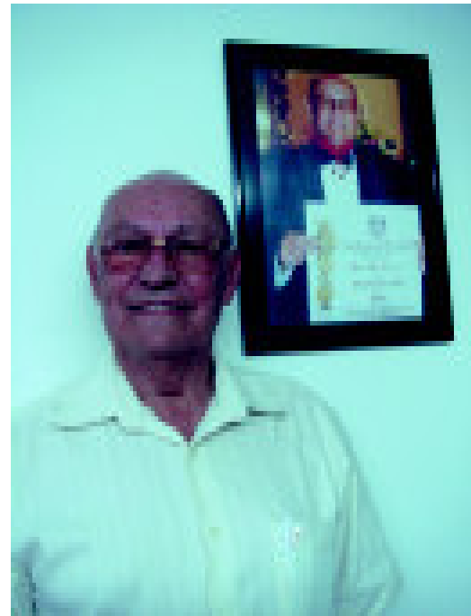
Nesta foto ele posa ao lado de sua fotografia quando recebeu a Medalha de Mérito Empresarial da Academia Brasileira de Arte, Cultura e História